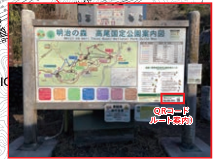
山麓の総合案内板