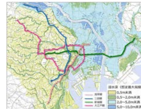
浸水予想区域図等の重ね合わせ図と都営地下鉄各路線図 (浸水予想区域図等をもとに交通局作成)

大規模水害については、東京メトロと連携してシミュレーションを実施し、荒川氾濫では、荒川右岸21km破堤、荒川右岸9.5km破堤の場合に、地下に流入した水がトンネルや乗換駅の接続部を通じて広がり、地下鉄ネットワークへの被害が特に大きくなることを確認できました。