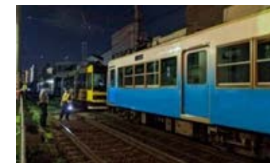
東京さくらトラム（都電荒川線） 車両避難訓練