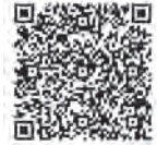
録画上映用 申込フォーム

※車椅子でのご来場又は手話通訳などのご希望がある場合には、申込時にお知らせください。