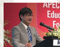
シンポジウムの座長