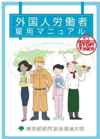
①外国人労働者雇用マニュアル