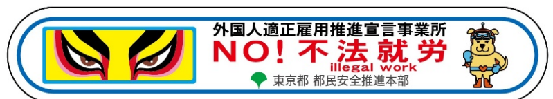
③外国人適正雇用推進宣言事業所マグネット