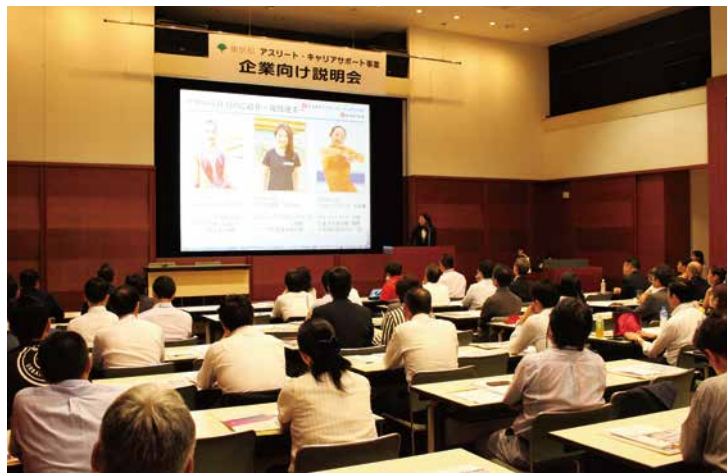
企業向け説明会の様子

2010年10月にスタートしたJOCの就職支援制度です。生活環境を安定させながら競技活動に集中したいと考える現役のトップアスリートと、それに理解を示して下さる企業とをマッチングし、スポーツ界と産業界に“WIN-WIN”の関係をつくることを目指しています。