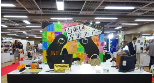
「台東区産業フェア2019」展示商談会

台東区はファッション関連産業が集積し、全国的にも有数の産地として発展してきた。一方で、スマートフォンやSNSの普及、新型コロナウイルスの感染拡大、SDGsムーブメントの定着などにより、多様化する消費者ニーズのくみ取りやECのような新たな販路や流通への対応等が地域産業の課題となっている。そこで、区内事業者と異業種や支援機関などの多様な主体との連携を促進し、消費者ニーズに敏感に、かつ、柔軟に対応するための経営力強化を図ることにより、地域産業活性化を目指す。