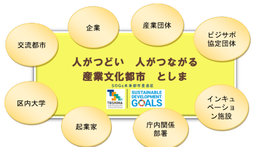
実現を目指す 10 年後の地域産業の将来像