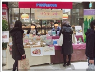
区内協定企業と連携した起業家向けチャレンジ出店企画

都市の活力を創出するため、より一層の創業支援・販路拡大支援を推進するとともに、感染症や自然災害などの発生による社会経済活動の変化や社会構造の変革による新たな事業者の課題に適切に対応する必要がある。そこで、としまビジサポ協定団体や地域産業団体、交流都市や区内大学等との連携を通して、お互いの強みを活かすとともに、豊島区が有する多様な文化資源・観光資源を最大限に活用しながら、区内中小企業・小規模事業者を支援する。