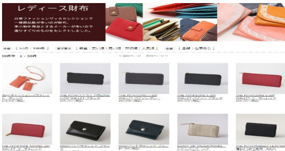
自社ブランド販売支援 (オンラインショップ出店の支援)