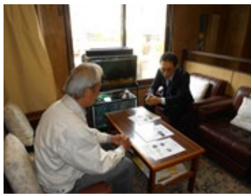
企業との対話を通じ課題解決や新製品開発等を支援