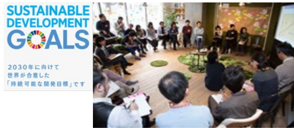
SDGsによる連携創出事業

日野市は、昭和期に大企業を誘致したことに始まり「ものづくりのまち」として発展してきたが、近年は大工場の移転や中小企業事業者数の減少が進んでいる。また、新型コロナウイルス感染症の拡大等により多くの企業で業績が悪化している。そこで、自前主義を脱却した外部連携、データやデジタル技術等の活用、バックカastingによる製品・サービス開発、ビジネスモデルの変革等を支援し、社会・経済環境変化への対応力を高めることにより、地域産業の活性化を目指す。