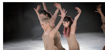
Noism Company Niigata

各種割引 (S～B席) シルバーエイジ割引：20% OFF (65歳以上) / U25 割引：50% OFF (生年月日1999年4月1日以降) ユニバーサル割引：30% OFF (ハンディキャップ手帳等をお持ちの方) ※未就学児入場不可 ※車椅子席、ユニバーサル割引は都響ガイドのみ取扱い