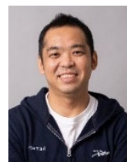
ノルベール・ルレ