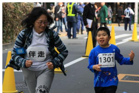
<目白ロードレース>