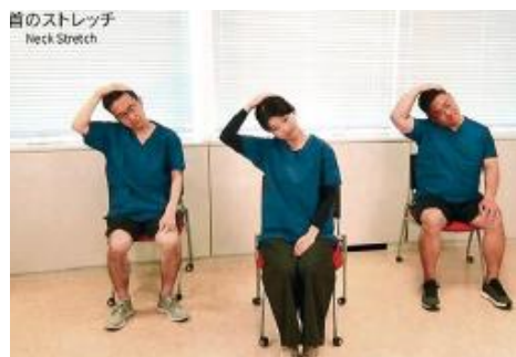
< アクサ体操 AXARCISE >