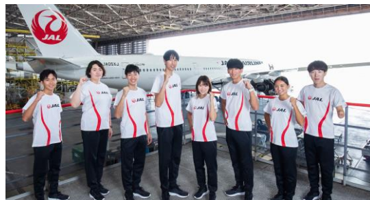
<現在8名のアスリート社員>