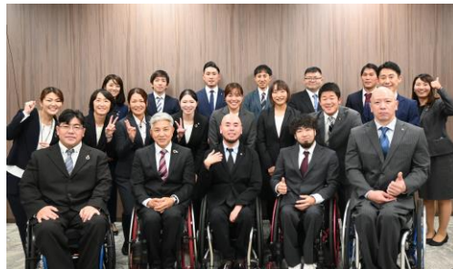
<障がい者アスリート社員との交流>