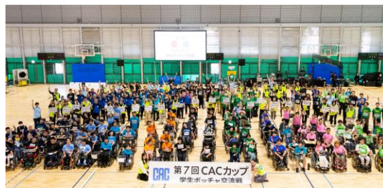
<ボッチャ大会「CACカップ」>