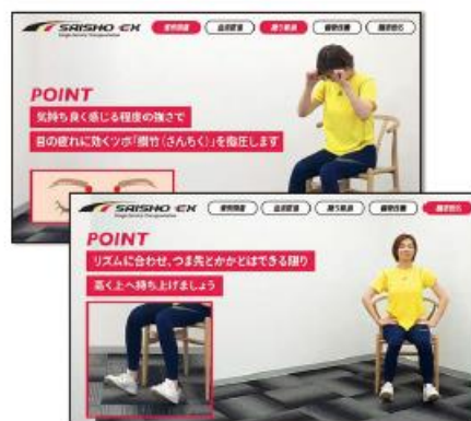
<サイショウ オリジナル体操>