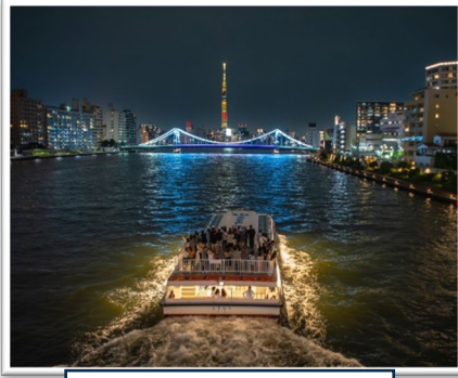
清洲橋と東京スカイツリー