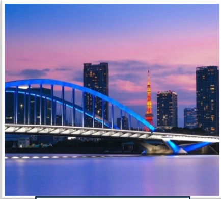
築地大橋と東京タワー