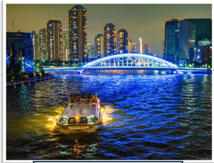
永代橋上流からの景色