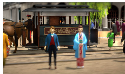
左：アキラくん 右：ハルちゃん

約260年続いた江戸時代が終わりを迎えた明治初年（1868年）から物語はスタートします。江戸と呼ばれていた都市は「東京」へその名を変え、明治時代が幕をあけます。西洋からの思想や技術、価値や文化を取り入れて近代国家へ躍進する日本。本アプリは、こうしたためまぐるしく変わる銀座の街、文明開化に生きた、ある家族の物語でスタートします。