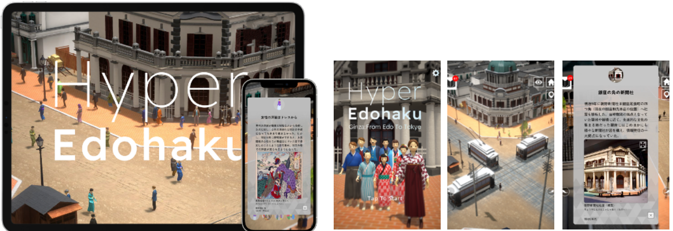
江戸東京博物館スマートフォンアプリ「ハイパー江戸博 明治銀座編」（4月26日リリース）

江戸博の収蔵品で「東京のはじまりをさがす、みつける、あつめる」 西洋化がすすむ明治時代の銀座を時間旅行しながら、 現代につながる文化や習慣を見つけよう