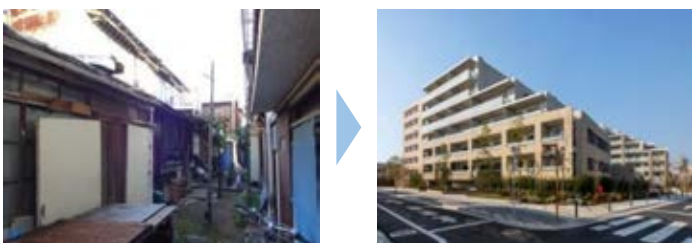
不燃化（共同化）の整備例 （中延二丁目旧同潤会地区）