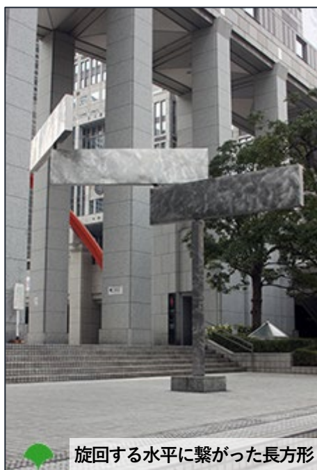
回転する水平に繋がった長方形

都庁舎アートワークにつきましては、皆さまに末永く御観覧いただけるよう、維持管理して参りますので、今後ともよろしくお願いいたします。