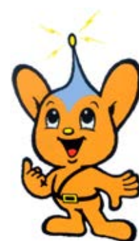
警視庁シンボルマスコット ピーポくん

今後とも、交通事故のない、「世界一の交通安全都市TOKYO」を目指し、各種交通安全対策を推進して参りますので、御理解と御協力をいただきますよう、よろしくお願いいたします。