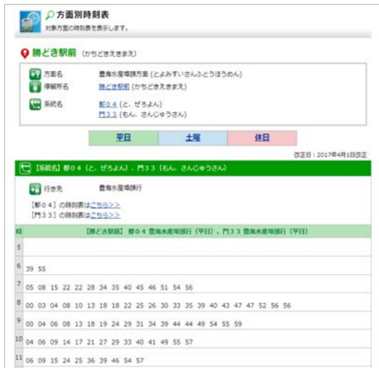
都04系統と門33系統をまとめて表示した時刻表

日頃より都バス運行情報サービスを御利用いただきまして、誠にありがとうございます。「豊海水産埠頭行」の勝どき駅より先の「都04系統」と「門33系統」の時刻表をまとめて表示して欲しいとの御指摘を踏まえ、別々に表示していた時刻表に加え、両系統を一つにまとめた時刻表を新たに追加しました。なお、同様のケースでもシステム上の制約等で対応できない場合もございますので、御了承ください。