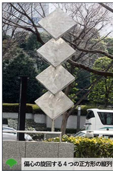
偏心の回転する4つの正方形の縦列