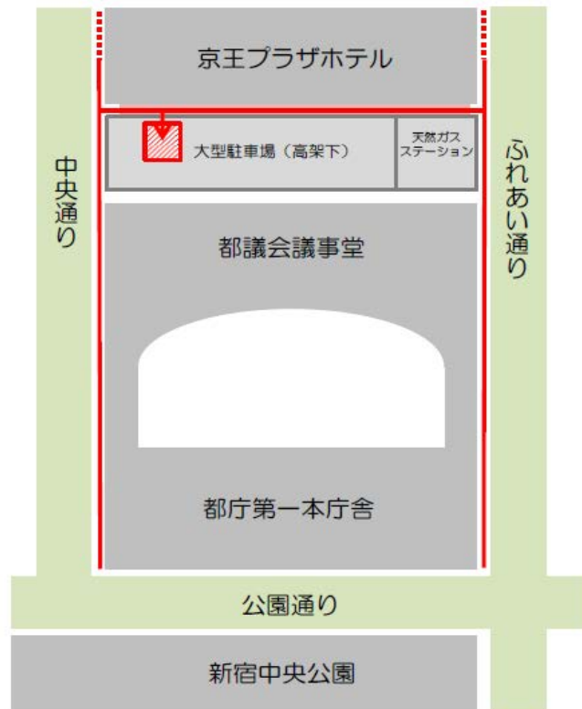
都庁一時利用者駐輪場（斜線部）