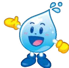
水道局マスコット 水滴くん

今後とも、都の水道事業に御理解と御協力をいただきますよう、よろしくお願いたします。