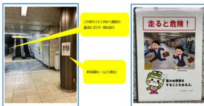
森下駅 新宿線から大江戸線への乗り換え旅客向け「走らないでください」ポスター