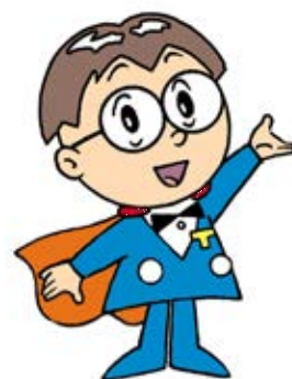
主税局イメージキャラクター タックス・タクちゃん

自動車税種別割の納期は、5月中であることが地方税法（第177条の9）で定められています。このため、東京都では毎年5月の第1開庁日に、自動車税（種別割）納税通知書を郵便局へ持ち込み、発送しています。令和3年度は5月6日に発送いたしました。発送数が多数のため、到着までに数日程度掛かる場合がございますが、納期限まで概ね3週間ほどの期間があります。今後は、発送日についても案内の機会を増やすなど、より一層分かりやすい周知に努めて参りますので、御理解と御協力をよろしくお願いいたします。