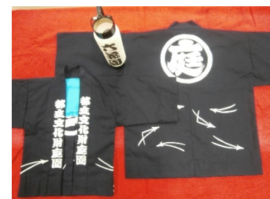
特製ちょうちん・法被