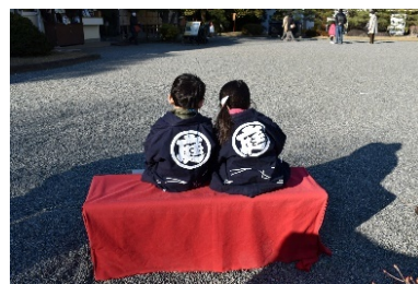
こども記念撮影コーナー