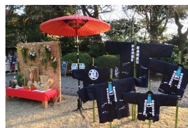
記念撮影コーナー