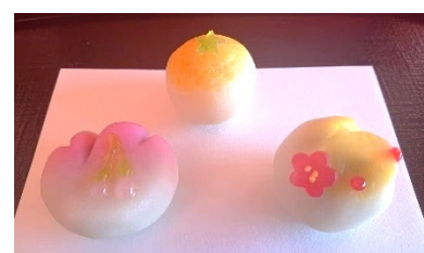
上生菓子(イメージ)

日 時 1月2日(月)・3日(火) 9時～16時45分(16時30分ラストオーダー) 場 所 吹上茶屋 内 容 風情溢れるお庭を眺めながらおいしい抹茶や 上生菓子をお召し上がりください。 価 格 抹茶と上生菓子のセット 850円