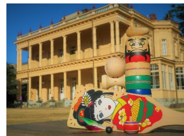
懐かしい子ども遊び