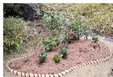
新春 寄せ植え展示

日 時 1月2日(月)・3日(火) 9時～17時 場 所 大正記念館前 内 容 新春の縁起物である福寿草・梅等の 寄せ植えを展示します。