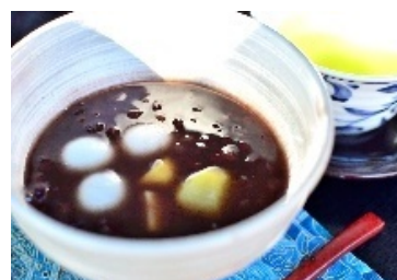
昨年度販売メニュー

日 時 1月2日(月)・3日(火) 10時～16時30分 場 所 大正記念館 内 容 軽飲食の販売を行います。 目の前に広がる庭園をお楽しみながら お抹茶などをお召し上がりください。