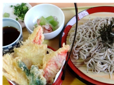
メニュー(イメージ)

日 時 1月2日(月)・3日(火) 10時～16時 場 所 小石川後樂園「 かんとくてい 涵徳亭」内びいどろ きりょう 茶寮 内 容 和定食やお抹茶など庭園が見えるお部屋で お楽しみください。