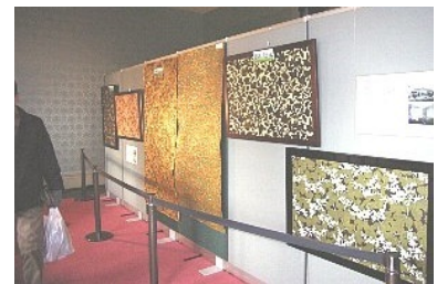
生花と金唐紙の展示