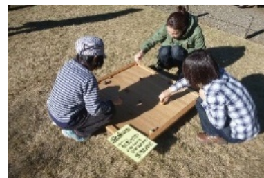
羽根つきと独楽広場