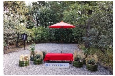
記念撮影コーナー