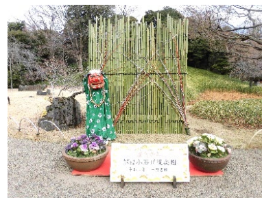
記念撮影コーナー