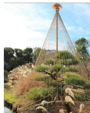
殿ヶ谷戸庭園の雪吊り