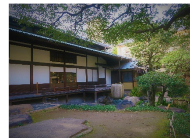
旧岩崎邸庭園 和館