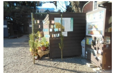
ウィッシングブース

内 容 旧岩崎邸庭園オリジナルウィッシングカードに新年の抱負や夢、願い事を書いてウィッシングブースに掛けることができます。