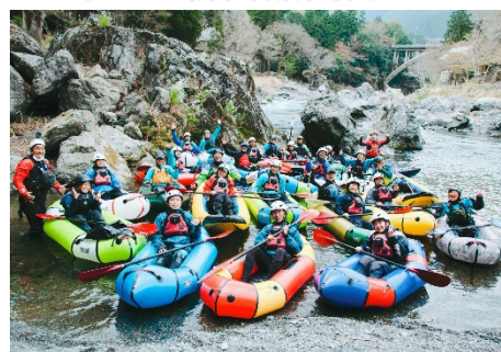
▲バックラフト・SUPボード

川に特化したウォータースポーツの自社ブランドMARSYASを立ち上げ、日本の川のアクティビティをより手軽に楽しめるオリジナル製品の開発及び販売で売り上げを伸ばした。