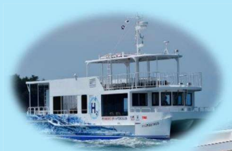
水素旅客船 「ハイドロびんご」