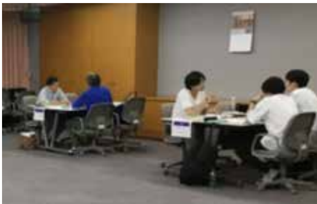
マッチング会の様子(商品開発)