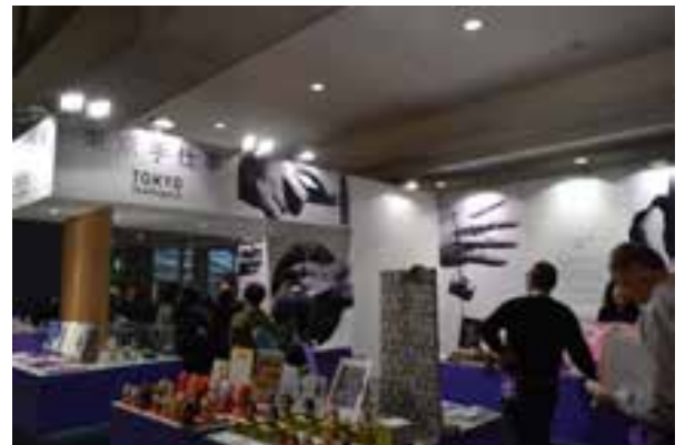
展示会出展の様子(普及促進)