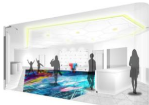
【デジタル映像による演出】