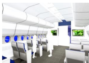
【飛行機内を模した空間】