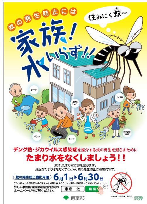
蚊の発生防止強化月間ポスター

https://www.fukushihoken.metro.tokyo.lg.jp/kankyo/eisei/yomimono/nezukon/mosquito.html