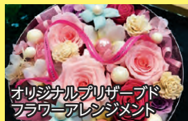
オリジナルプリザーブド フラワーアレンジメント