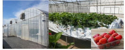
東京フューチャーアグリシステム

「東京フューチャーアグリシステム」は、(公財)東京都農林水産振興財団の登録商標(登録番号第6196995号)。