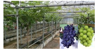
東京型ブドウ環境制御栽培システム