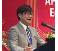
シンポジウム当日の座長