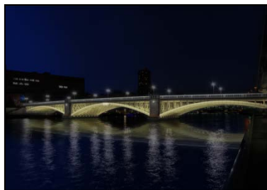
橋梁ライトアップ (蔵前橋)

⇒夜の隅田川を美しく照らし、東京の新たな観光名所に ⇒夜間照明により、水辺に彩りを添え、安心して歩ける空間に