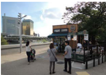
オープンカフェ (隅田公園)

⇒ 地元との合意形成を要件とし、民間事業者による オープンカフェ、川床 (かわてらす)などを運営