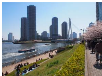
スーパー堤防 (新川・箱崎地区)