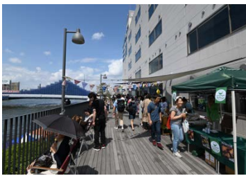
LYURO東京清澄 (清洲橋下流)