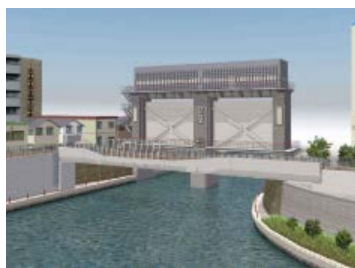
連続化橋梁イメージ (大島川水門)