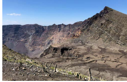
雄山火口付近の様子