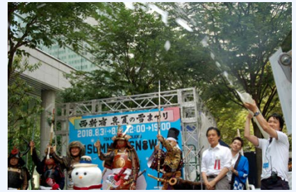
真夏の雪まつり(2018年8月)