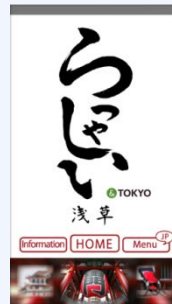
アプリ(らっしあい浅草)