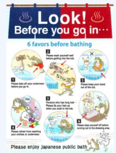
入浴方法案内リーフレット