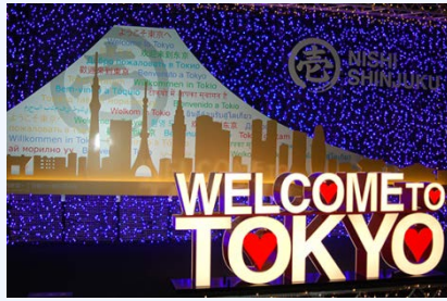
イルミネーション(2018年2月)