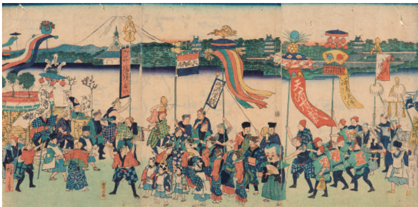
御酒頂戴 明治元年 三代安藤広重画