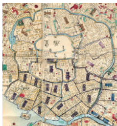
永福東京御絵図 明治4年