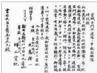
宮城正門外2贈正三位西郷隆盛銅像建設の件に付宮内大臣より指令の件 明治25年