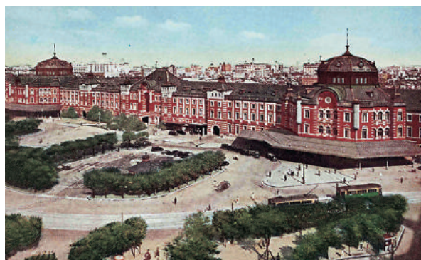
帝都の大玄関東京駅の壮観(大正3年竣工)

Expansion and transformation in a capital area