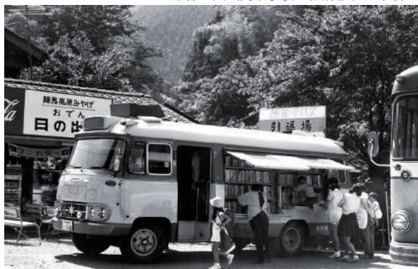
移動図書館むらさき号 昭和30~40年代