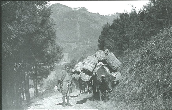
「青梅の山中にて」 1894年(明治27)11月22日