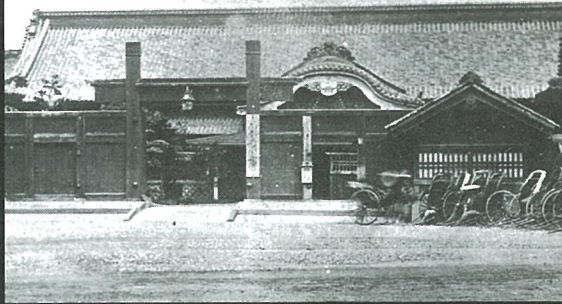
初代東京府庁舎 明治前期