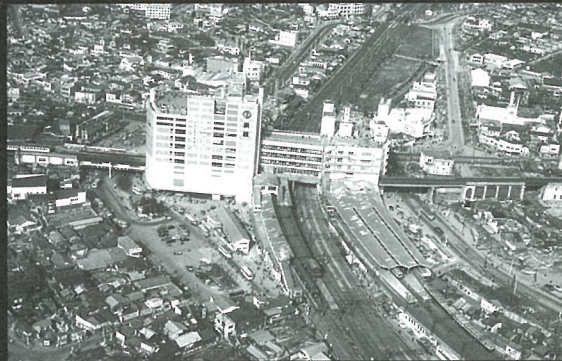
空撮写真(渋谷駅) 1954年(昭和29)11月29日

1868年(慶応4)7月17日、江戸を東京と改める詔書が発せられ、東京府が設置されました。この時誕生した「東京」は、今年で150年の節目を迎えます。維新の混乱の中からスタートした東京の街は、震災や戦災などによって幾度となく傷つきながらも、そこに暮らす多くの人々の尽力によって復興を遂げ、首都として発展を続けました。