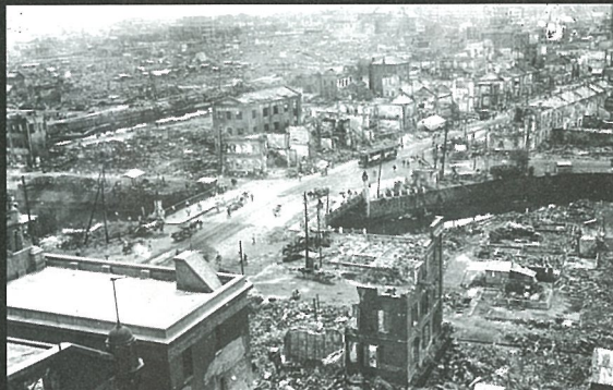
関東大震災の被害 京橋より銀座方面 1923年(大正12)