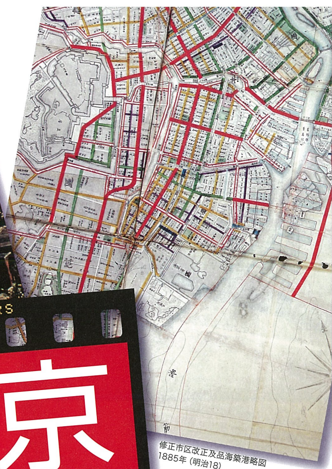
修正市区改正及品海築港略図 1885年(明治18)