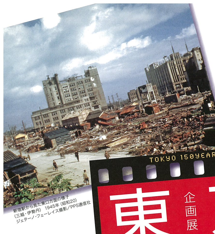
新宿駅から見た東口方面の様子 (三越・伊勢丹) 1945年(昭和20)