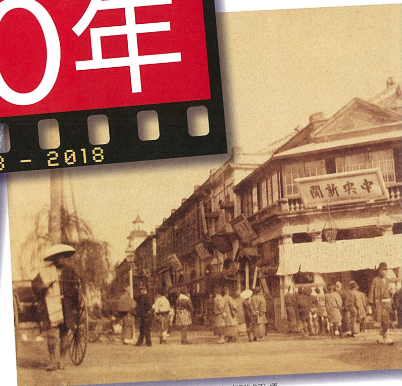
「銀座中央新聞社号外張出」 1894年(明治27)頃

平成30年 8月7日火 → 10月8日月・祝 東京都江戸東京博物館 常設展示室内 5F企画展示室