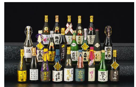
金賞を受賞した福島の日本酒

福島県の観光案内パンフレットを配布し、福島の温泉や、鶴ヶ城などの観光名所等の観光PRを実施します。