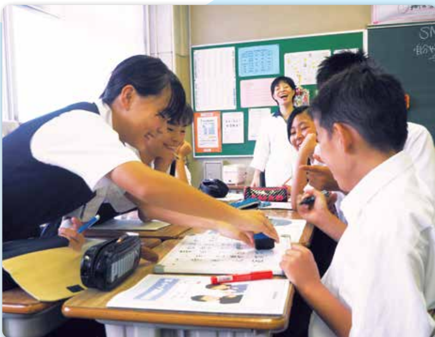
「ルールづくりの話合い」の様子 (中学校)