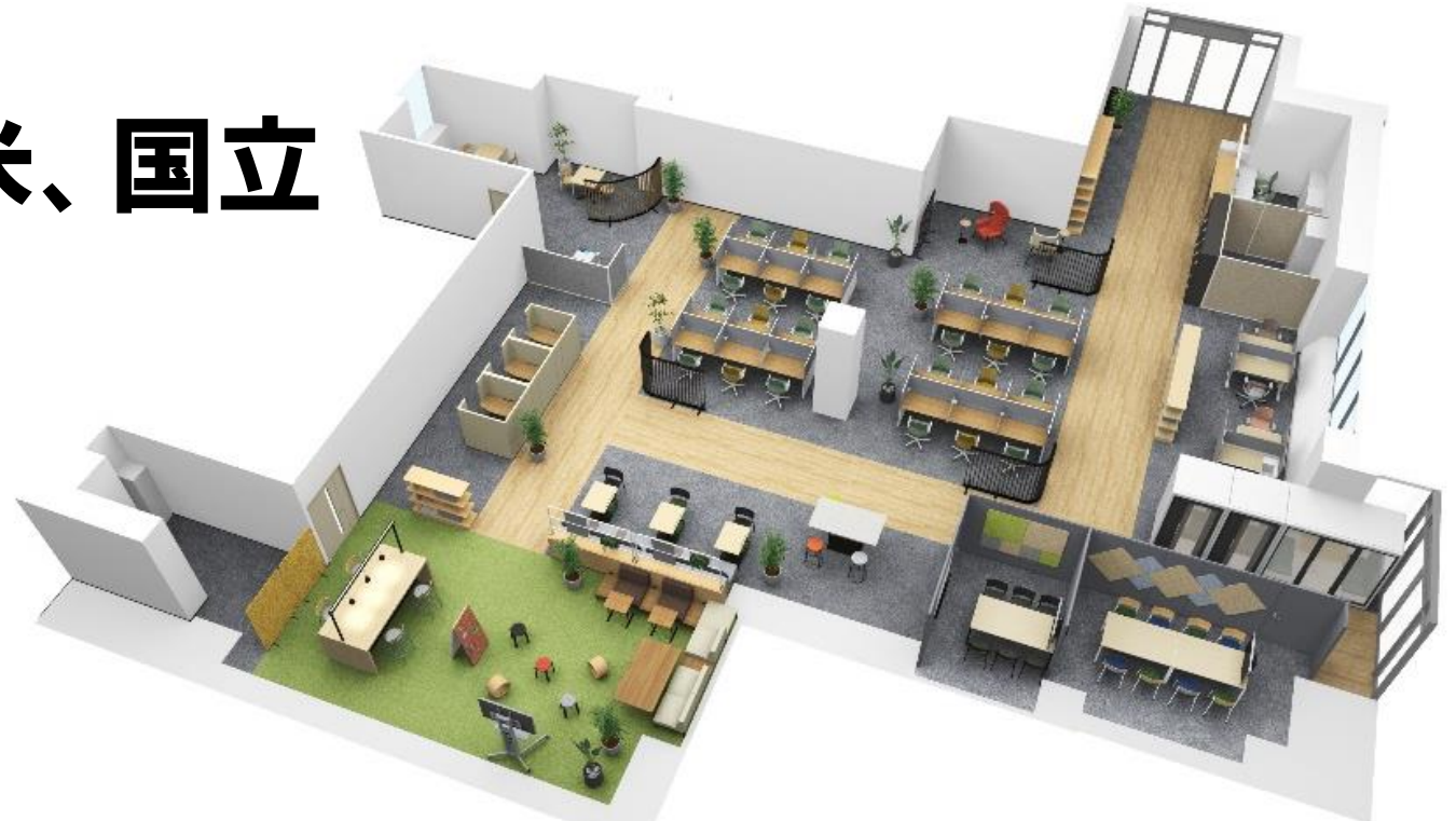
<TOKYOテレワーク・モデルオフィス府中 パース図>