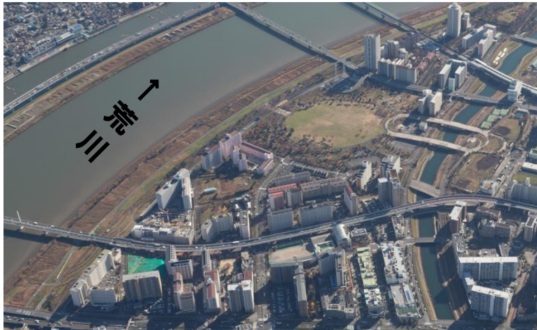
高規格堤防整備と再開発を一体実施した小松川地区

○目的 防災まちづくりを強力に推進していくため、 国と東京都の実務者において検討