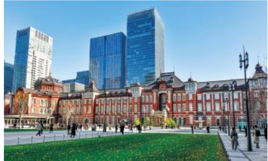
復元された東京駅