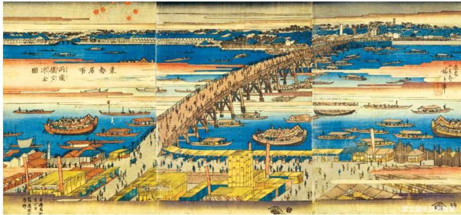
江戸時代の両国橋