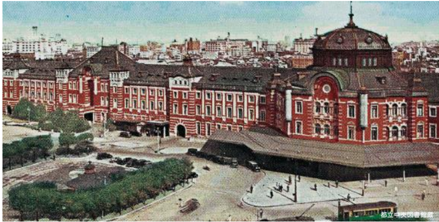
大正初期に竣工した東京駅