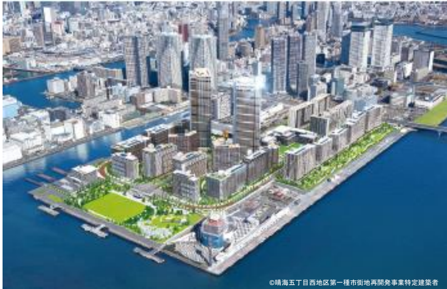
東京2020大会後の選手村 (完成イメージ)