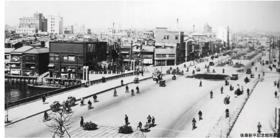
震災復興で整備された昭和通り