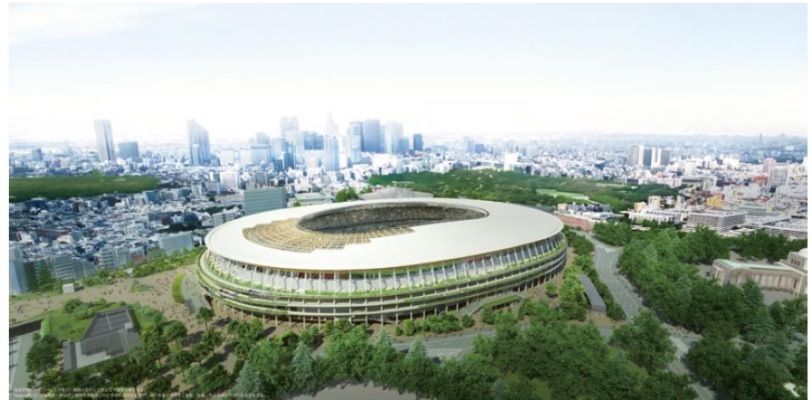
オリンピックスタジアム (完成イメージ)