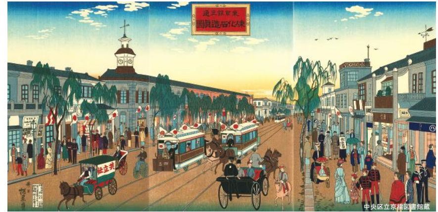
明治時代の銀座煉瓦街