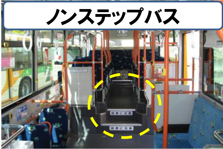
ノンステップバス