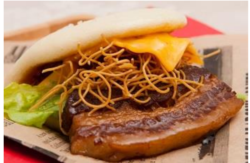
角煮バーガー (長崎県)