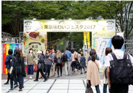
東京国際フォーラム