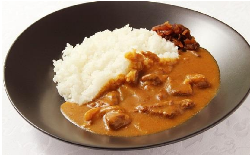
ハイカラビーフカレー