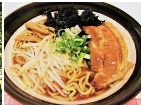
八丈島産 岩のりらーめん