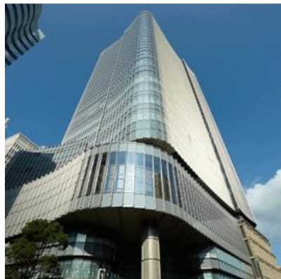
東京ミッドタウン日比谷