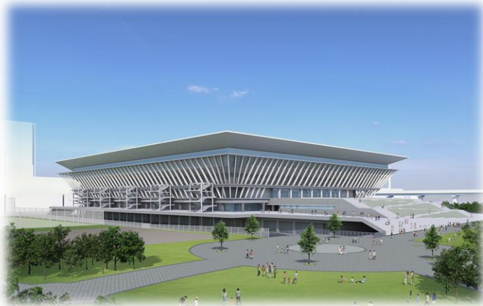
東京アクアティクスセンター