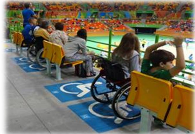
車いす席(イメージ)