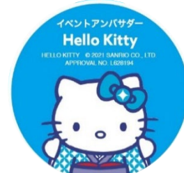
<イベントアンバサダー>