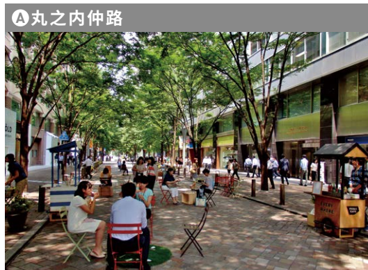
A 丸之内仲路 行人专用道路时间段 工作日: 上午11点~下午3点 节假日: 上午11点~下午5点