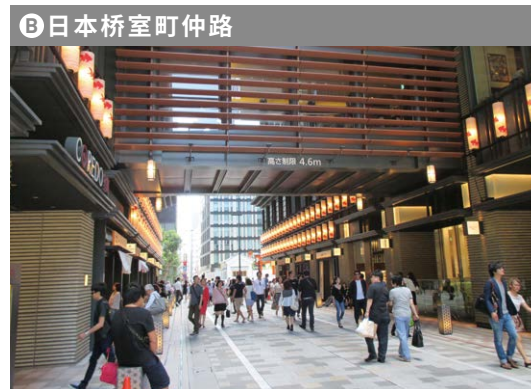
B 日本桥室町仲路 行人专用道路时间段 工作日, 节假日: 上午11点~晚上8点