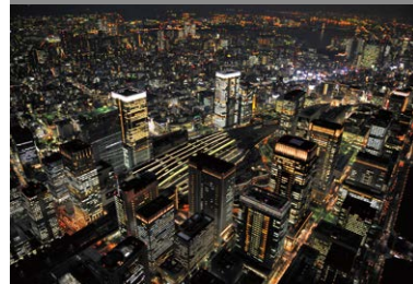
大手町·丸之内·有乐町(大丸有)

这里是作为日本第一条办公街而发展起来的。近年来，逐渐演变为一块充满繁华之景的商业空间。