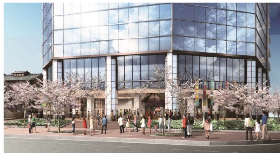
■イベントスペース