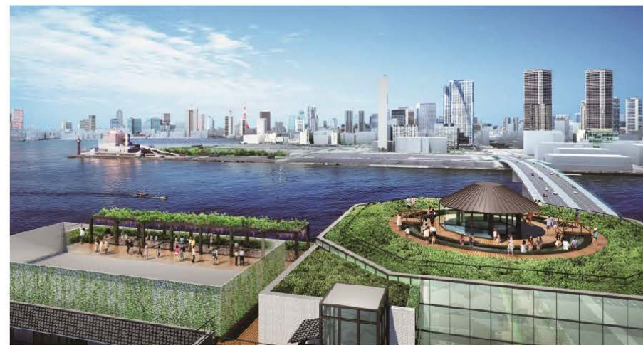
■屋上の展望デッキに足湯を設置