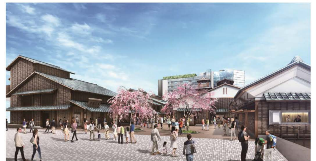
■ゆりかもめから段差なしでアプローチ可能な商業ゾーン