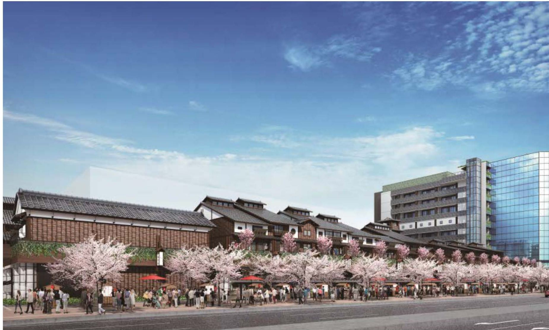
■環状二号線側からの景観