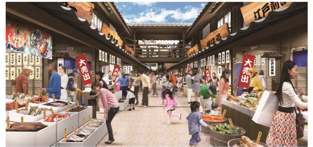
■江戸の街並みを再現したオープンモール