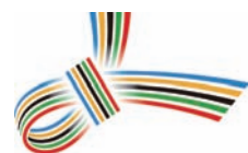
当委員会ロゴ「結び」

(当委員会ホームページ: http://www.tokyo-sc.or.jp/ )