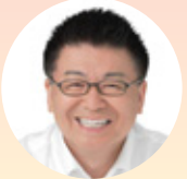
フリーアナウンサー 生島 ヒロシ氏