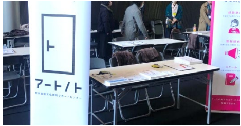
令和6年1月「ART JOB FAIR」内での出張相談の様子

外部の専門家等とも連携しながら、東京で活動するアーティスト等を対象とする相談対応窓口を運営。出張相談も実施しています。